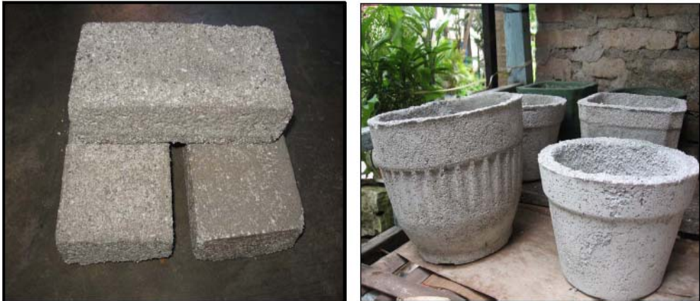
Gambar 5: Penghasilan batu bata dan pasu bunga di Indonesia dengan komposisi 1 simen, 3 pasir, 3 styrofoam dan air.

Secara puratanya setiap individu di Malaysia menjana sisa pepejal sebanyak 0.8 kilogram sehari, dan kadar ini pastinya akan meningkat bersesuaian dengan peningkatan sisa pepejal sebanyak 2.5 peratus setahun. Pada tahun 2010 sahaja, dianggarkan 26,000 tan sisa pepejal dijana setiap hari. Pada 2015, sebanyak 7,772, 402 tan sisa pepejal dihasilkan oleh lebih 31 juta penduduk Malaysia. Angka tersebut dijangka meningkat sehingga 10 juta tan pada tahun 2020. Dan yang pastinya ialah hampir 50 peratus daripada sisa pepejal ini adalah terhasil daripada makanan.