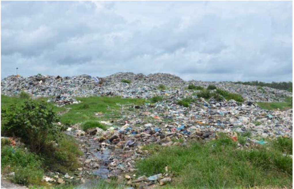
Gambar 3: Tapak Perlupusan Sisa Pepejal sementara di Padang Siding yang hanya akan beroperasi sehingga penghujung tahun 2013.

Pada tahun 2014, tapak pelupusan sampah baru dikenali sebagai ‘Tapak Pelupusan Sanitari’ akan beroperasi sepenuhnya di Rimba Emas berhampiran Felda Chuping. Tapak yang menggunakan teknologi moden ini mampu merawat ‘ leachate ’ daripada mencemar saliran air bawah tanah dan mempunyai penutup harian dengan menggunakan alas dari tanah atau plastik yang akan dapat mengelak bau busuk dan menghalang daripada gangguan binatang seperti anjing, tikus, ular dan lain-lain lagi. Tapak perlupusan baru ini juga akan dilengkapi loji rawatan dan jambatan timbang serta dikawal komputer sepenuhnya.