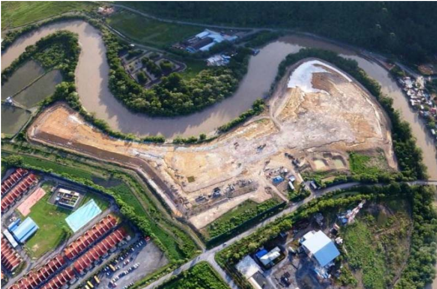
Gambar 1: Tapak Perlupusan Sisa Pepejal di Kampung Wai selepas ditimbus dengan tanah sebagai sebahagian daripada kaedah rawatan selamat.