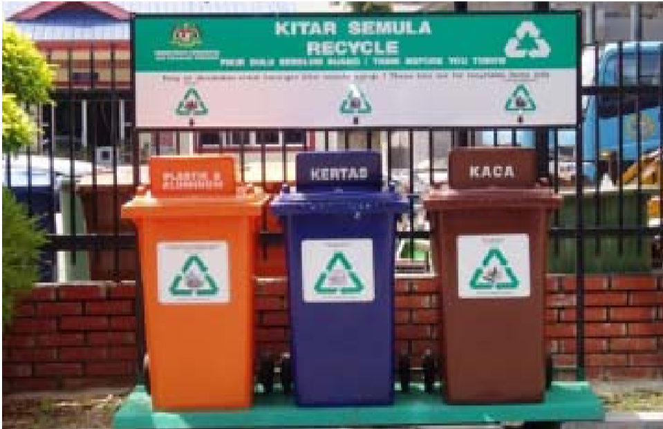
Gambar 4: Antara kemudahan kitar semula yang disediakan oleh PPSPPA di seluruh negara Perlis.

Pelbagai inisiatif boleh diambil oleh sekolah-sekolah, institusi pengajian tinggi dan setiap keluarga dengan aktiviti penghasilan baja 'kompos' di belakang rumah, mengambil makanan pada kadar yang diperlukan sahaja, perbanyakkan penghasilan sumber makanan organik, bidang hiliran yang menyokong aktiviti kitar semula, stesyen kitar semula, pengurusan sisa pepejal, mengurangkan majlis-majlis makan dan pelbagai inisiatif lain boleh dirangka.