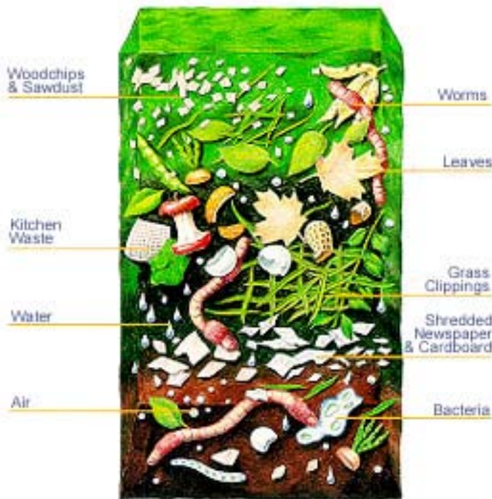
Rajah 3: Komposisi yang didapati dalam kebanyakan teknik kompos yang dipraktikkan.

Kompos sebenarnya adalah baja semulajadi untuk sektor pertanian dan amat bersesuaian bagi pekebun berskala kecil seperti individu yang berkebun di persekitaran rumah. Kompos yang lengkap dan baik mestilah berkeadaan seroi, berwarna hitam dan berbau tanah. Budaya kompos masih belum diterima sepenuhnya oleh masyarakat Malaysia kerana kurangnya pengetahuan tentang peri pentingnya kompos ini. Disamping mengurangkan sisa pepejal yang dibuang ke dalam tong sampah, ianya juga akan menjimatkan kos individu daripada membeli baja kimia atau organic, ini adalah kerana baja kompos merupakan baja yang sangat baik dan berkesan.