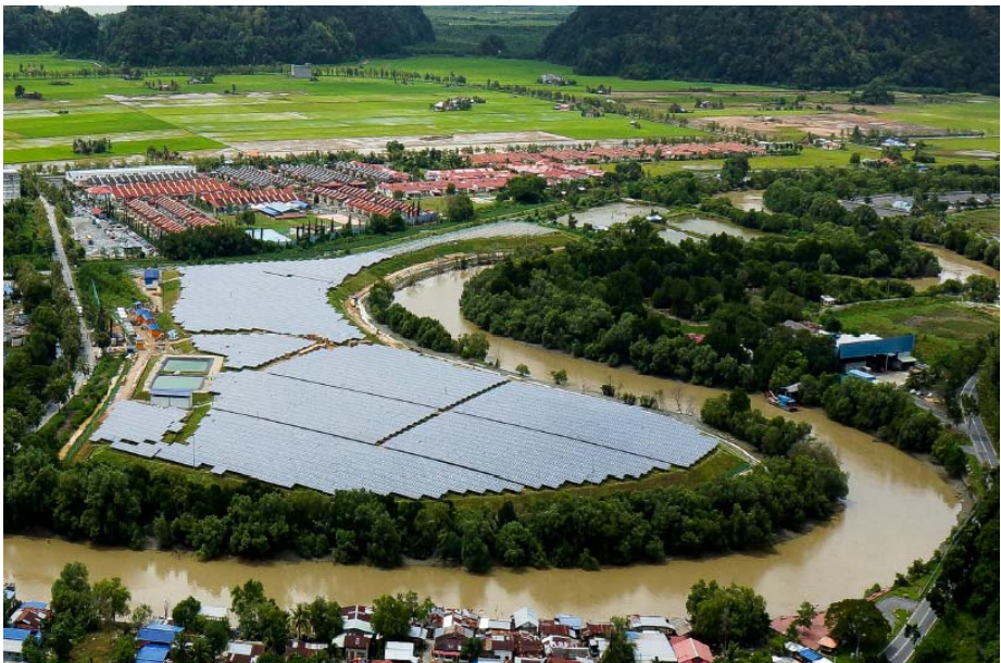
Gambar 2: Tapak Pelupusan Sisa Pepejal Kampung Wai yang telah berubah wajah menjadi 'Ladang Tenaga Solar' sebagai sebahagian daripada program penjanaan kewangan dan kearah kelestarian negeri Perlis.

Keadaan yang jauh berbeza di kawasan ini dapat dilihat, tiga tahun yang lalu hampir semua pengguna laluan ini akan menekup hidung mereka dengan tangan kerana tidak tahan bau busuk yang terhasil daripada kawasan ini. Akan tetapi hari